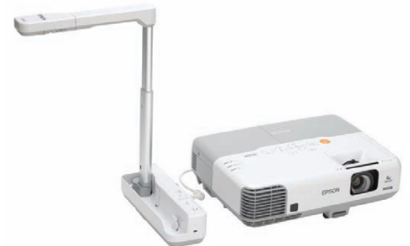
3D-Objekte einfach präsentieren mit der Dokumentenkamera Epson ELP-DC06